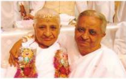
देवी माता जी के साथ