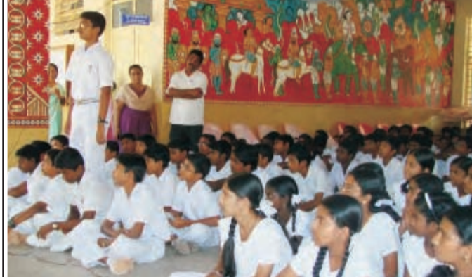
अलेपी। जवाहर नवोदय विद्यालय के बच्चों ध्यानपूर्वक स्वास्थ्य संबंधी शिक्षाएं सुनते हुए।