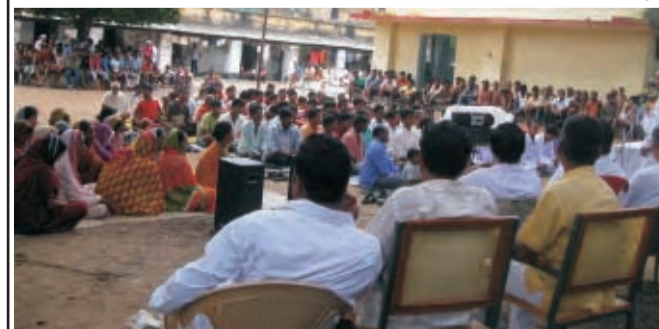
बालासोर। जेल में आयोजित कार्यक्रम के दौरान अभियान के सदस्य कैदियों को सम्बोधित करते हुए।