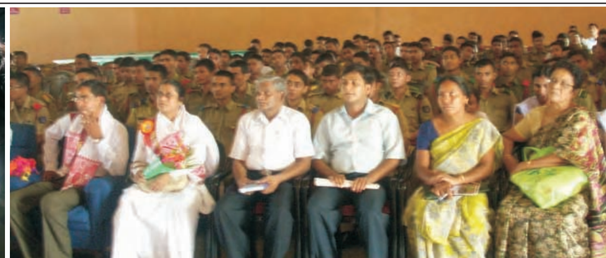
गोलपारा (गुवाहाटी)। सैनिक स्कूल में आयोजित स्वास्थ्य जागरूकता शिविर दौरान उपस्थित स्कूल के छात्र तथा अन्य।