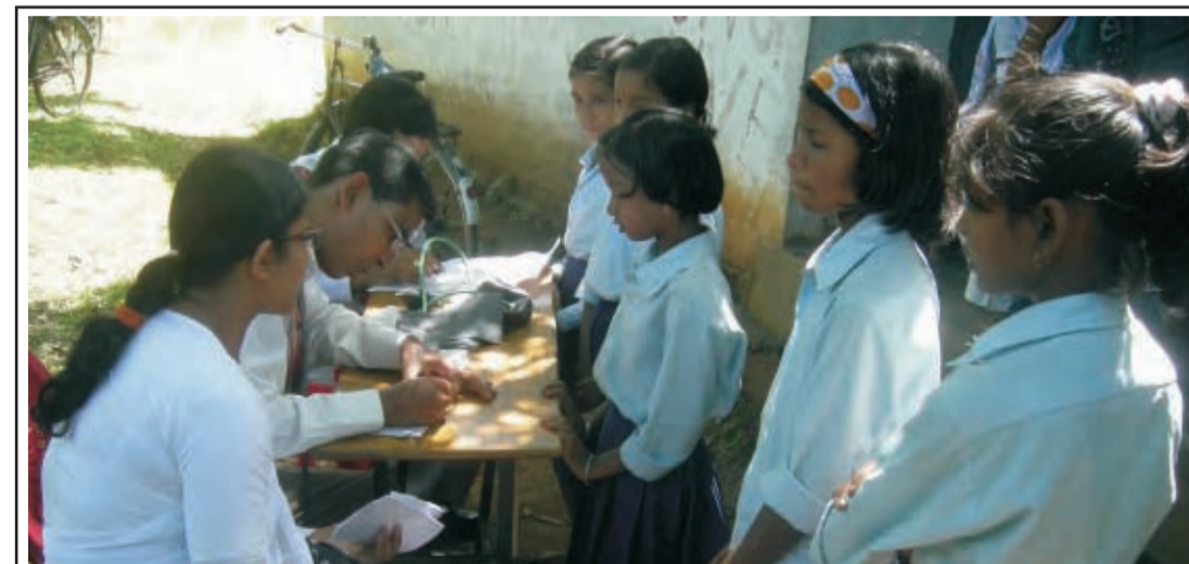
गुवाहाटी। नहरा गांव में बच्चों का स्वास्थ्य परीक्षण करते हुए अभियान दल के डाक्टरस।