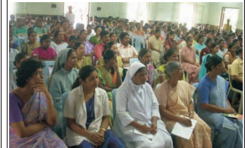
पटना। पब्लिक कार्यक्रम में वक्ताओं के विचार सुनते हुए नगर के प्रबुद्ध जन।