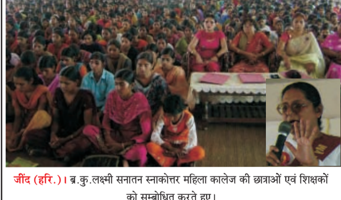
जींद (हरि.)। ब्र.कु.लक्ष्मी सनान स्नाकोत्तर महिला कालेज की छात्राओं एवं शिक्षकों को सम्बोधित करते हुए।