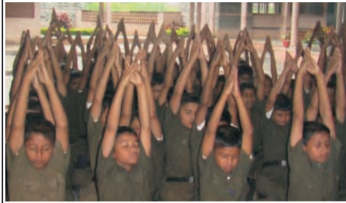
सतारा। सैनिक के छात्रों को एक्सरसाइज कराते हुए अभियान दल के सदस्यगण।