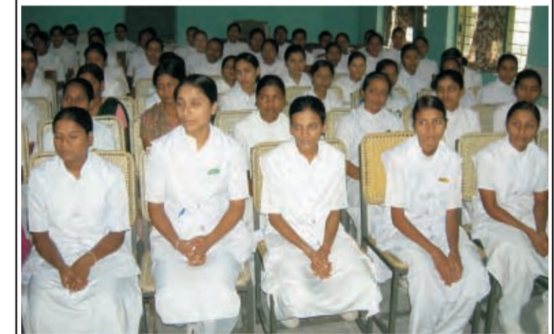
रैवा। नर्सिंग कालेज की छात्राएं अभियान दल के डाक्टरों से स्वास्थ्य से सम्बन्धित जानकारी से लाभान्वित होते हुए।