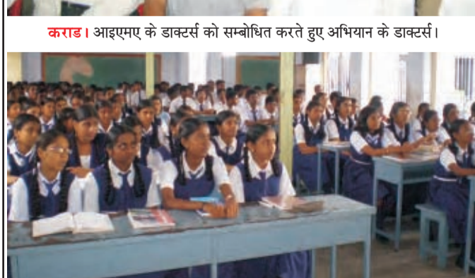
त्रिची। स्कूल के बच्चों के लिए आयोजित कार्यक्रम के दौरान का दृश्य