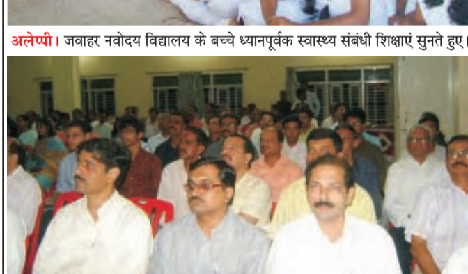
कराड। आइएमए के डाक्टरों को सम्बोधित करते हुए अभियान के डाक्टरों।