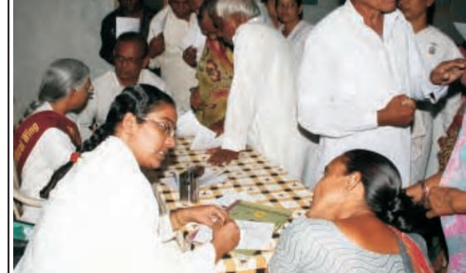
तलोद-अहमदाबाद। स्वास्थ्य परीक्षण शिविर के दौरान का दृश्य।