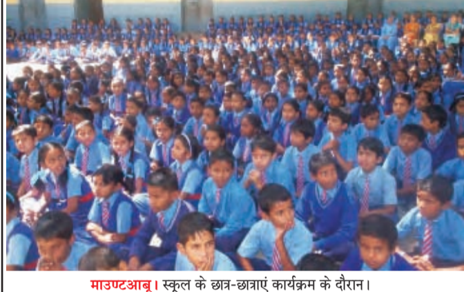
माउण्टआबू। स्कूल के छात्र-छात्राएं कार्यक्रम के दौरान।