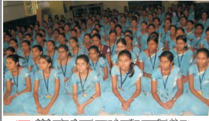
भरुक। पीटीसी कालेज की छात्राएं स्वास्थ्य से सम्बंधित जानकारियां लेते हुए।

इस यात्रा से लाभान्वित होने वाले लोगों की संख्या है -102794