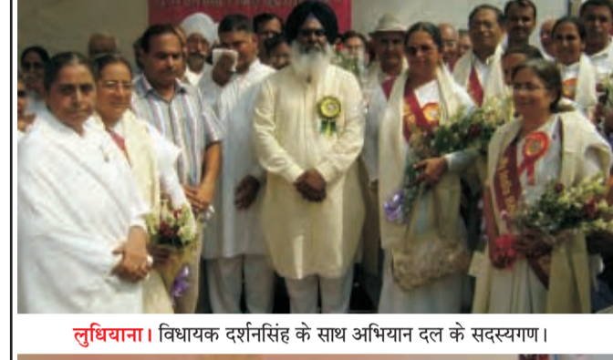
लुधियाना। विधायक दर्शनसिंह के साथ अभियान दल के सदस्यगण।