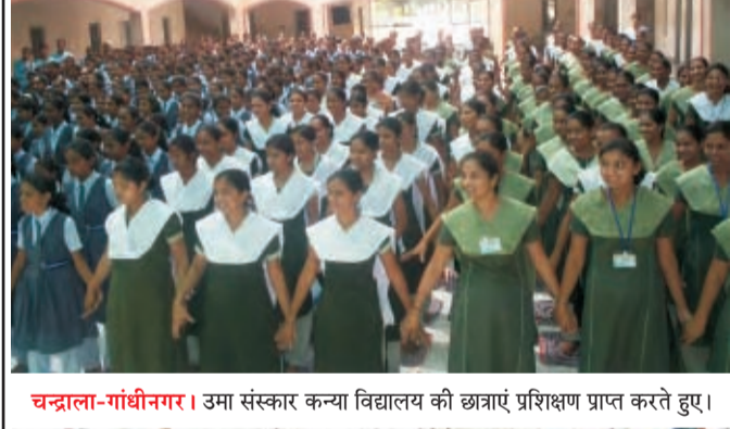
चन्द्राला-गांधीनगर। उमा संस्कार कन्या विद्यालय की छात्राएं प्रशिक्षण प्राप्त करते हुए।