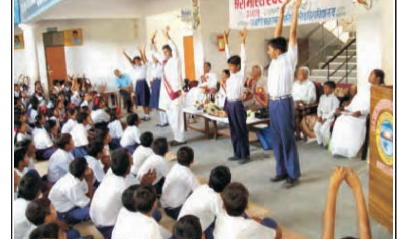
ब्र.कु.हरीश स्कूल के छात्र-छात्राओं को व्यायाम सिखाते हुए।