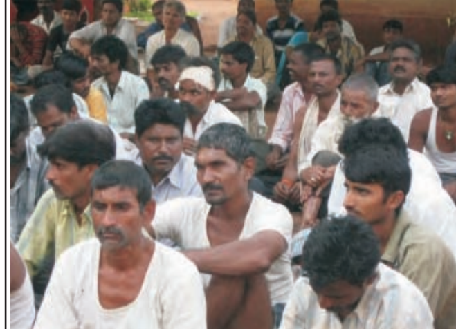
बीदर। जेल में आयोजित कार्यक्रम में कैदी भाईयों में स्वास्थ्य के प्रति जागरूकता लाते हुए।