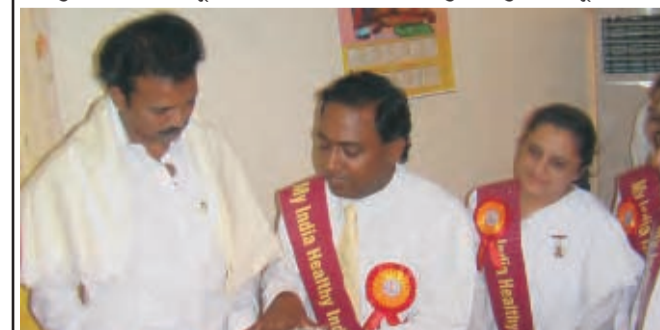
बैंगलोर। कर्नाटक के स्वास्थ्य मंत्री श्रीरामुलु को अभियान के दौरान की जा रही सेवाओं की जानकारी देते हुए अभियान के सदस्य।