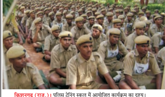
किशनगढ़ (राज.)। पुलिस ट्रेनिंग स्कूल में आयोजित कार्यक्रम का दृश्य।