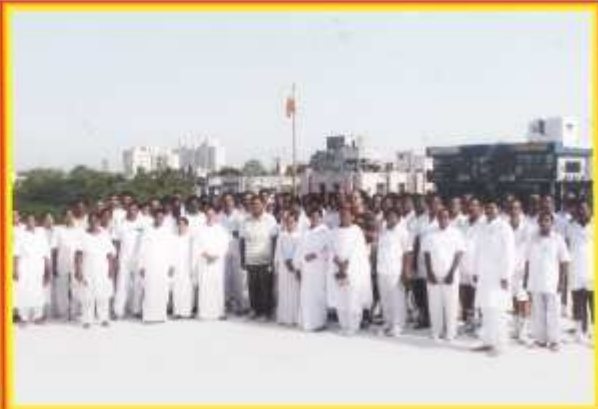
சென்னை: சைதாப்பேட்டை சென்டர் புதிய இடத்திற்கு மாற்றப்பட்ட நிகழ்ச்சியினை மூத்த சகோதரிகள் மற்றும் சகோதரர்கள் மூலமாக கேக் வெட்டி கொண்டாடப்பட்டது